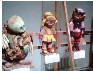
i EXTERIOR DIRECTE